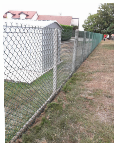
La clôture en grillage de l'école "Aux Quatre Vents" à Malmont a été remplacée