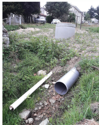
Sécurisation et busage d'un puit à Jurine