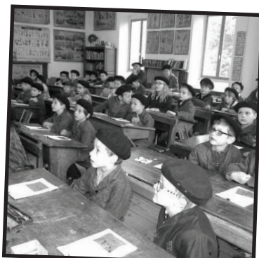
Les GS et CP à l'école d'autrefois