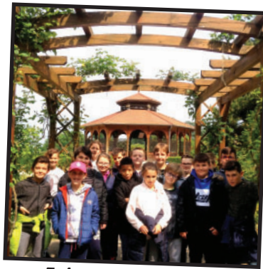
Enigmes au château de Bouthéon