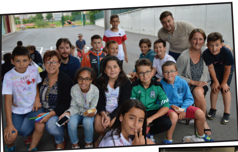
Moment convivial en ce dernier jour d'école lors du pique-nique de fin d'année du restaurant scolaire