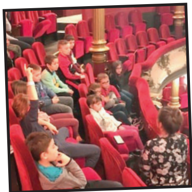
A l'Opéra de Lyon