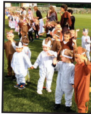
Défilé avant spectacle de fin d'année : "de vraies stars!"