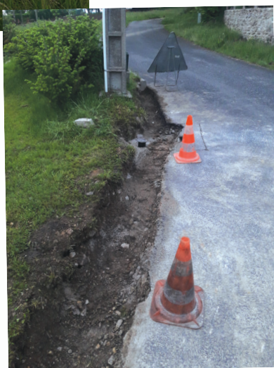
Pose de bordures basses aux Sagnes pour mieux canaliser l'eau pluviale