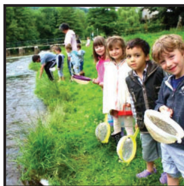
Les PS et MS à la pêche