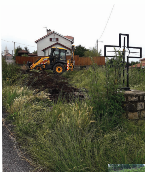
Aménagement d'un espace vert sur le carrefour de la D10 et l'entrée de Malmont