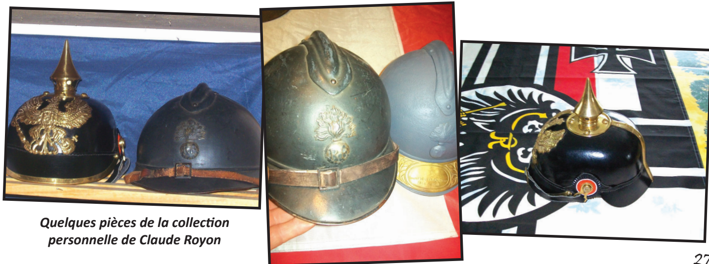
Quelques pièces de la collection personnelle de Claude Royon

Cette exposition se tiendra à la salle polyvalente. Celle-ci sera réservée aux scolaires le vendredi 9 novembre. Elle sera ouverte au public le samedi 10 novembre et le dimanche 11 novembre, de 9H00 à 12H00 et de 15H00 à 18H00.