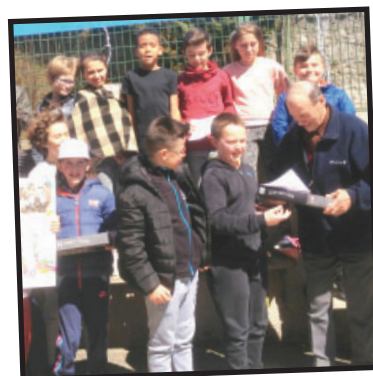
Remise officielle du jeu "St-Just Tour" aux Amis du Vieux St-Just