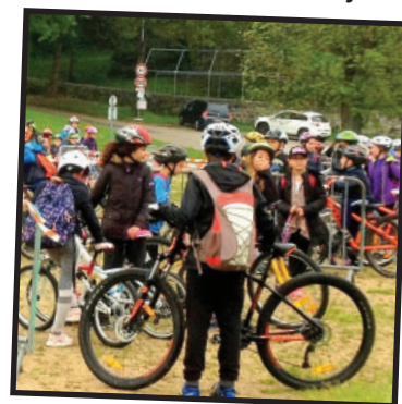
Sortie VTT avec CM du réseau et 6ème du collège