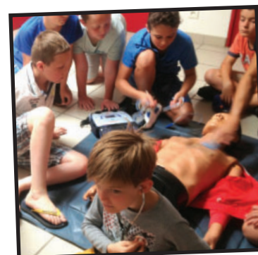
Initiation aux gestes de premiers secours

Merci aux parents de notre école et à tous les bénévoles qui interviennent auprès des élèves !!! Inscriptions et renseignements au 04 77 35 60 74 Site internet www.ecole-donbosco.fr