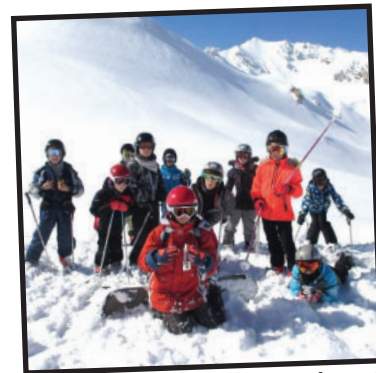
Classe de neige à Courchevel