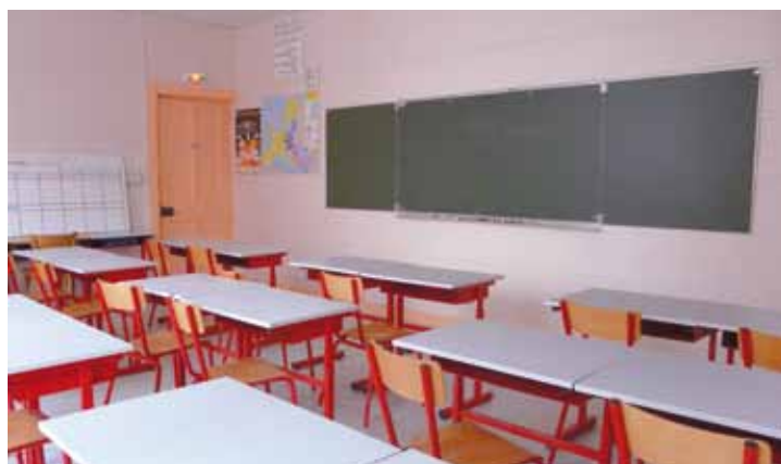
A l'école primaire, des classes ont été rénovées par les agents municipaux.