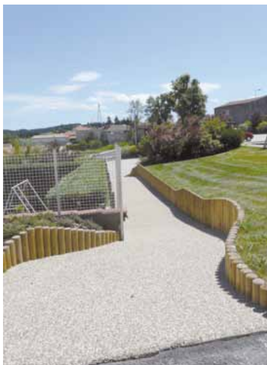
Aménagement de l'accès de l'école maternelle au restaurant scolaire.