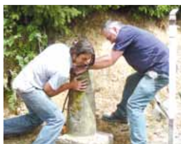
Déplacement de la barrière au Stade de Malmont