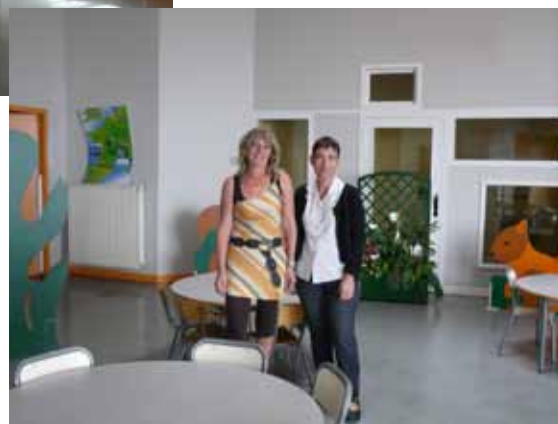
Après nettoyage et transformation, les locaux de l'ancienne crèche ont été aménagés en restaurant scolaire pour les enfants les plus jeunes.

Bien d'autres travaux ont été réalisés par les agents municipaux (mur de la Chaize, fleurissement de la croix du Petit Roure...). Nous les remercions pour leur prise d'initiative et la qualité du travail qu'ils fournissent au quotidien dans l'exercice de leur fonction.