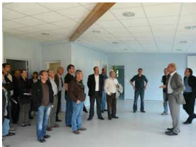
Visite de la crèche de Saint Just Malmont par les élus de Loire-Semène