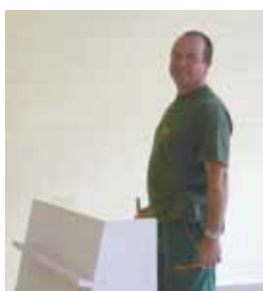
Réfection d'une salle de classe (école primaire)