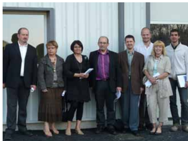
Les élus municipaux visitent la pépinière d'entreprise de Pont Salomon.