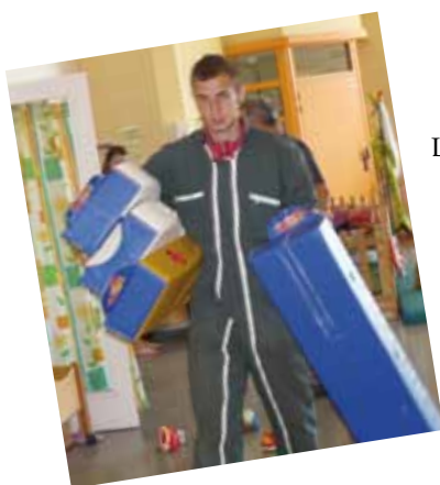
Les agents municipaux participent au déménagement de la crèche