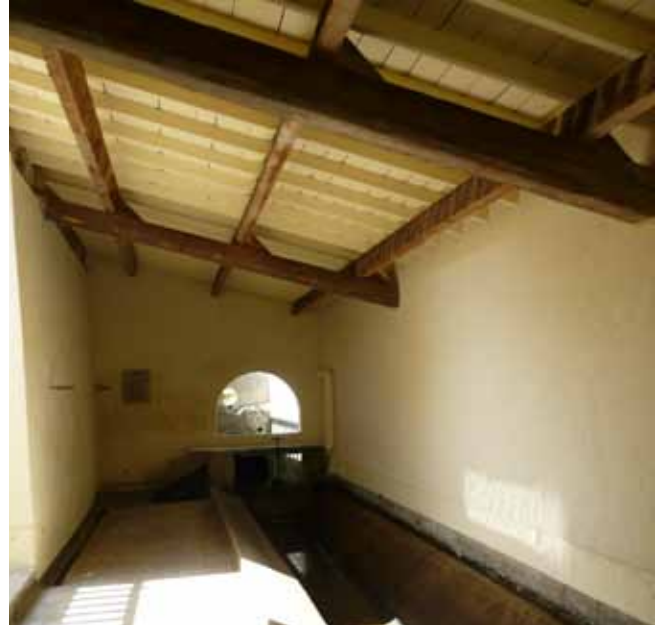
Le lavoir du Pêcheur rénové par la communauté de communes