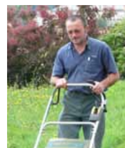
Entretien des espaces verts